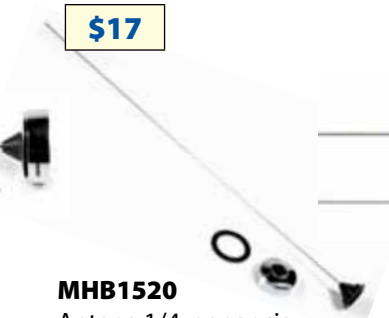
MHB1520 Antena 1/4, ganancia unitaria, 150-162 Mhz