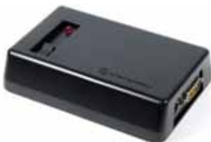
RLN4008 Interface de programación