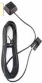
AARMN4027 Micrófono para visera de auto