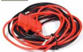
HKN4137 Cable de alimentación para móviles