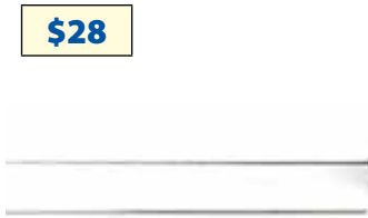
MFT-120 Antena 1/4, ganancia unitaria, 118-940 Mhz