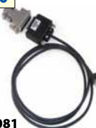
RKN4081 Cable de programación para radio