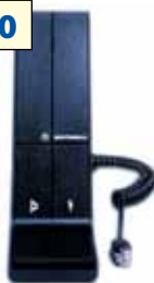
RMN5068 Micrófono de escritorio para base