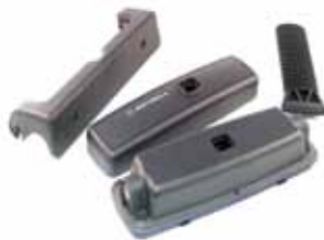
RLN4801 Montaje remoto (requiere ordenar cable RKN4077/78/79)