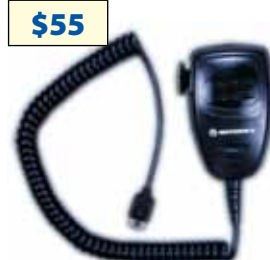
AARMN4025 Micrófono compacto para línea PRO móvil

Precios en dólares más IVA. Precios sujetos a cambio sin previo aviso.