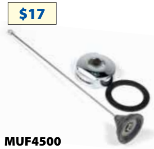
MUF4500 Antena 1/4, ganancia unitaria, 450-470 Mhz