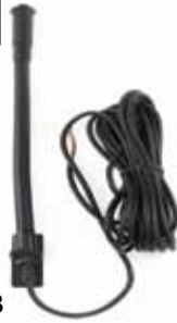
RLN4858 Pin conector auxiliar de accesos para móvil