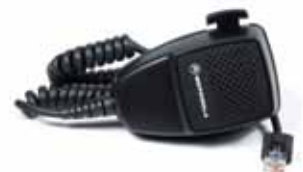
HMN3596 Micrófono compacto para móvil