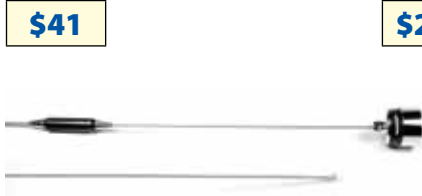
MUF4505 Antena 5/8, 5 Db ganancia, 450-470 Mhz