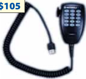
AARMN4026 Micrófono DTMF para línea PRO móvil