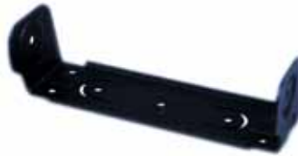
GLN7324 Montaje para radios móviles línea PRO