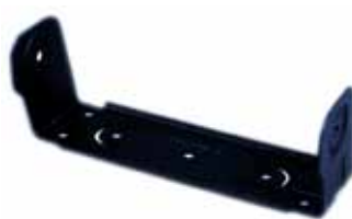
GLN7317 Montaje para GTX móvil