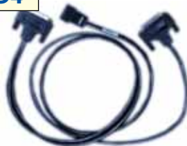
AARKN4083 Cable de programación serie PRO móvil