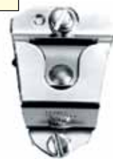
HLN9073 Broche de metal para micrófono móvil