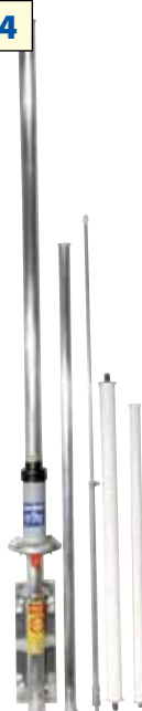
G7-150-1 Antena omnidireccional, 7 Db, 148-155 Mhz